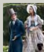
The Young Victoria (2009) di Jean-Marc Vallée