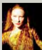
Elizabeth (1998) di Shekhar Kapur