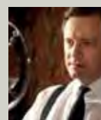
Il discorso del re (2010) di Tom Hooper