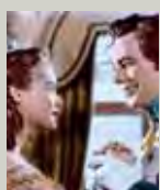
L'amore di una grande regina (1954) di Ernst Marischka

Non cerco mai di suscitare del sentimentalismo attraverso i miei personaggi, ma piuttosto di veicolare un'emozione che non sia necessariamente di compiacenza o compatimento. L'emozione che suscita Marvin proviene dalla sua vulnerabilità, da quello che prova e da quello che è capace di fare nonostante il contesto che lo circonda. Ciò che m'interessa non è la sua situazione disperata, ferma al punto di partenza, ma piuttosto la sua rinascita, la sua volontà di diventare un individuo nuovo.